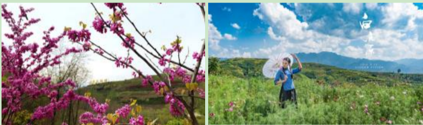
白鹿原影视城——“风起正清明 寻春白鹿原”踏青赏花主题月

春回大地，重重绿意。春风将青绿肆意铺向山川大地，无论是在草木葱郁的白鹿原影视城，还是被绿衣萦绕的华清宫，都将春的美好呈现得淋漓尽致，尽显人与自然的和谐相处。