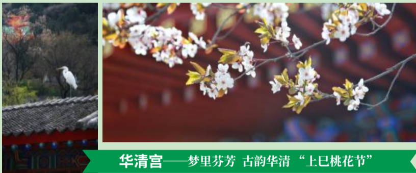
华清宫——梦里芬芳 古韵华清“上巳桃花节”

春花绽放正当时，“花样”陕旅的美方才伊始。诸葛古镇迎来了油菜花、古旱莲的观光热潮；漫山的桃花相继绽放在壶口岸边，壶口瀑布迎来一年一度的最美“桃花汛”。此时正适合带上家人朋友，赶赴这场春日盛会。