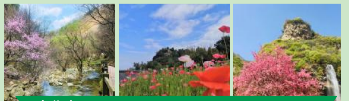
少华山——“鸢飞纸鸢 春满少华”少华山风筝文化节