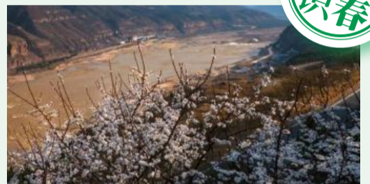
壶口景区——“最美桃花汛”

春花绽放正当时，“花样”陕旅的美方才伊始。诸葛古镇迎来了油菜花、古旱莲的观光热潮；漫山的桃花相继绽放在壶口岸边，壶口瀑布迎来一年一度的最美“桃花汛”。此时正适合带上家人朋友，赶赴这场春日盛会。