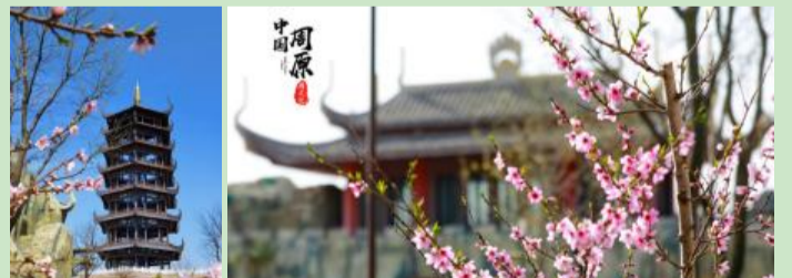
中国·周原——“筝艳周原”第三届风筝文化节

周原景区青翠广阔的草坪，让它在这个四月毫无悬念的荣登放飞纸鸢绝佳场地。少华山有着丰富的自然景观和浓厚的历史典故，这里风景宜人，景点密布，最是感受春意的好去处。这个四月，两地将举办风筝文化节，邀请风筝高手及风筝艺人进行现场放飞，游客可近距离观赏风筝，感受精湛的放飞技术。让春风将手中的纸鸢送上天空，赴一场春日宴。