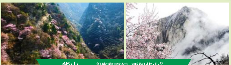
华山——“踏春而行 西阅华山”