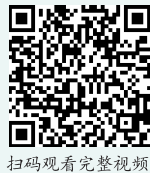
扫码观看完整视频

来等方面来解读陕旅高质量发展密码。网友们表示，访谈栏目形式新颖，品质精良，纷纷为陕旅集团送上赞誉和祝福，对陕旅集团的项目及未来发展充满期待。