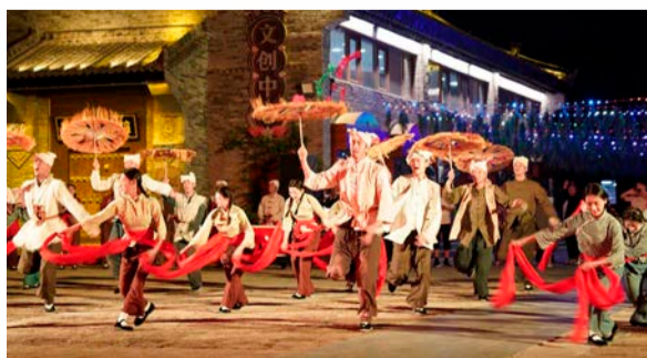
红色文化主题演出

立足陕西红色旅游发展的广阔前景，陕旅集团将用心用力保护好、传承好、利用好红色资源，让游客读懂革命先辈艰难困苦的求索历程，不断汲取智慧和勇气，增强信心与力量，为红色旅游创新发展提供“陕旅样本”。