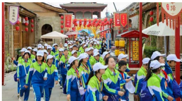
红色之旅主题活动