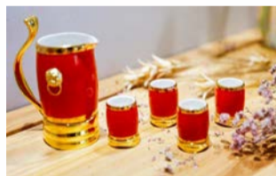
“鼓舞中华”腰鼓酒具

红色文创方面，陕旅红色景区设有文创产品服务中心，在静态资源中植入互动元素，增加游客体验。金延安“延知有礼”文创品牌成功推出了一系列深受游客喜爱的产品，用现代文创语言让红色文化走近消费者、走到生活里。其中“红星照耀中国”产品屡获殊荣，“鼓舞中华腰鼓酒具”“红宝”均荣获国家知识产权局颁发的外观设计专利证书。